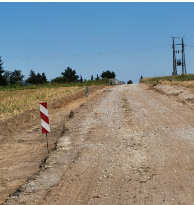
7. Przebudowa drogi w Strzeszkowicach