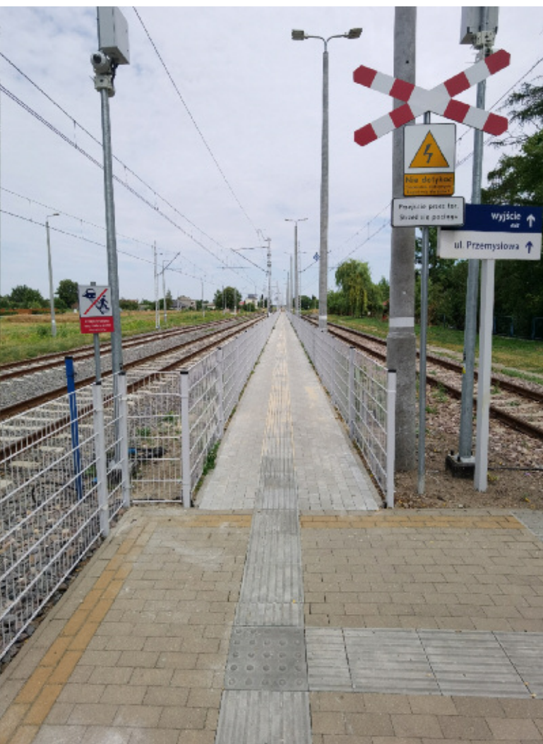
1. Chodnik przy ul. Przemysłowej do peronu na stacji kolejowej w Niedzwicy Dużej